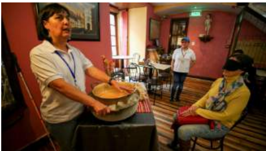
Figura 3.8. Animación Turística Guías Locales con discapacidad visual, colectivo Viviendo Quito con Sentidos .