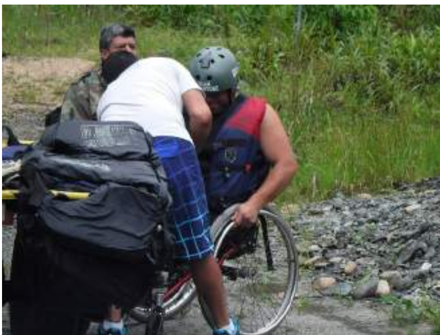
Figura 3.30. Operación Turismo Accesible REDTAEC

En opinión del fundador de REDTAEC, uno de los principales problemas identificados en la operación de turismo accesible en Ecuador es la falta de transporte bajo la normativa de adaptación de espacios para que las personas con movilidad reducida puedan trasladarse entre los diferentes destinos y atractivos.