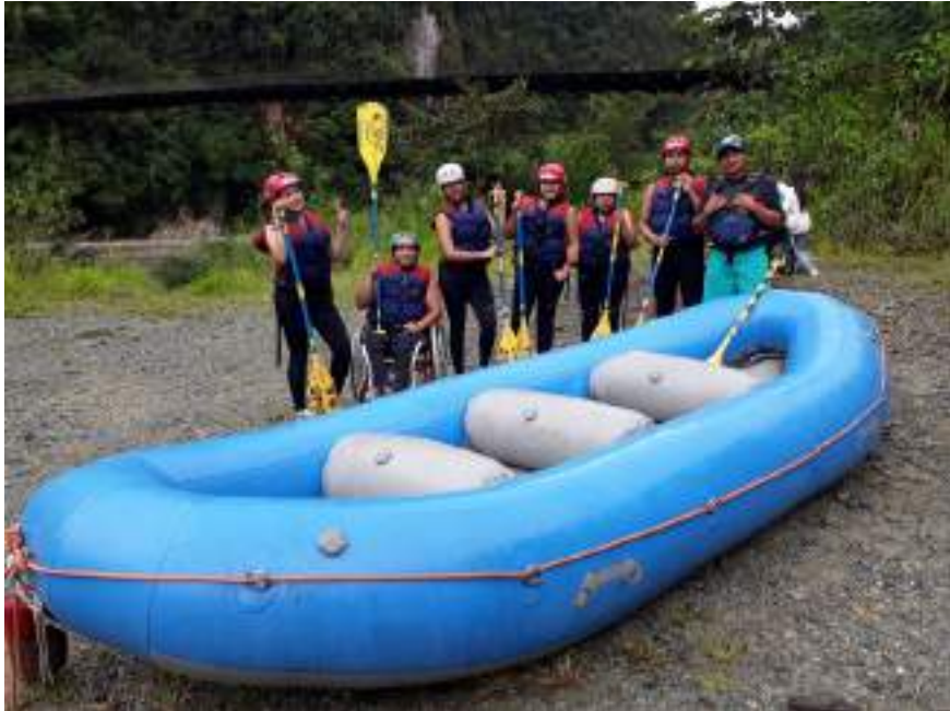
Figura 3.27. Turismo de Aventura para personas con movilidad reducida, REDTAEC