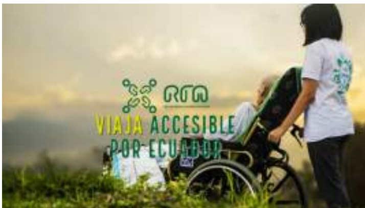
Figura 3.25. Turismo Accesible Ecuador

En el caso de REDTAEAC se debe tomar en cuenta que la generación de experiencias, parten desde la realidad de su fundador que posee una discapacidad de movilidad.