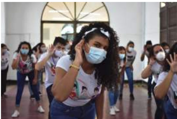
Figura 3.22. Experiencias en aprendizaje Lengua de Señas

En el caso de los sordos es muy difícil comunicarse no hay acceso a la información más que a través del lenguaje de señas, si vas a un atractivo en el Ecuador, nadie sabe lengua de señas, he ahí el principal reto la preparación del sector.