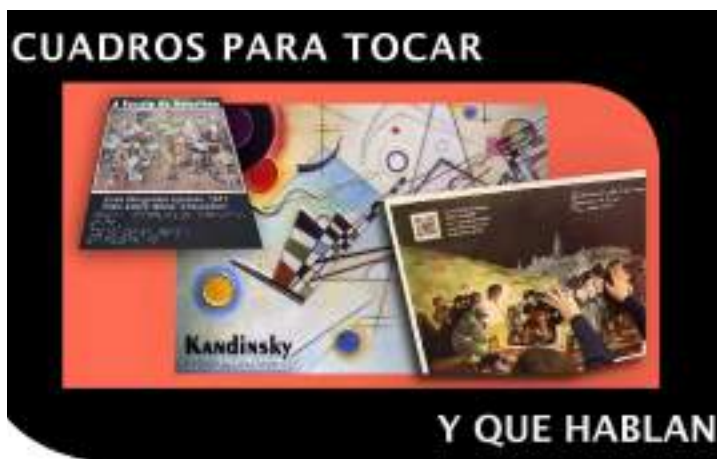
Figura 04. Cuadros en alto relieve y con audio.