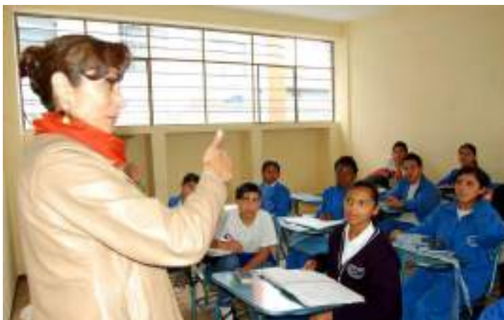
Figura 3.14. Educación en Lengua de Señas

Los proyectos ejecutados, nos reflejan la necesidad que desde la academia se empiece a concientizar y capacitar a los futuros profesionales del turismo sobre estos segmentos de mercados, las mallas de turismo deberían contener por lo menos una materia relacionada al turismo accesible, sin formación previa no podemos hablar de generación de experiencias y de convertirnos en un futuro en un país competitivo para el segmento.