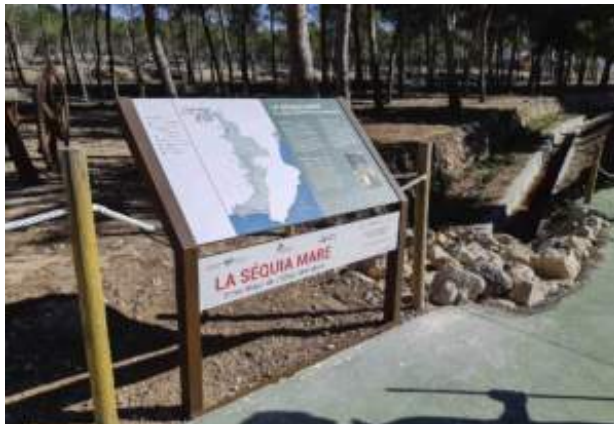
Figura 06. Mapas parlantes.