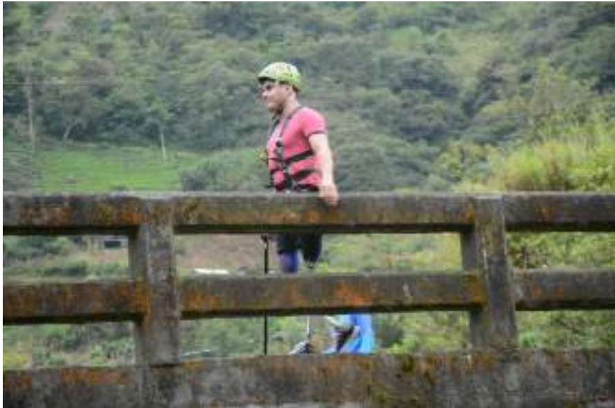
Figura 3.34. Experiencias Turismo Accesible, desde el enfoque de los turistas

En temas de inversión el apoyo de ONG´s tiene un lado positivo y un lado negativo, como positivo Alfonso Morales identifica el hecho de poder contar con un presupuesto que apoye al diseño de infraestructuras y capacitación, sin embargo el lado negativo es que si estos proyectos se trabajan con personas que no cuentan con la experticia en este tipo de operación en el territorio llegan a ser mal utilizados, invirtiéndose en estrategias aisladas, y de esta forma se han gastado millones de dólares que a la final no ha dado resultados.