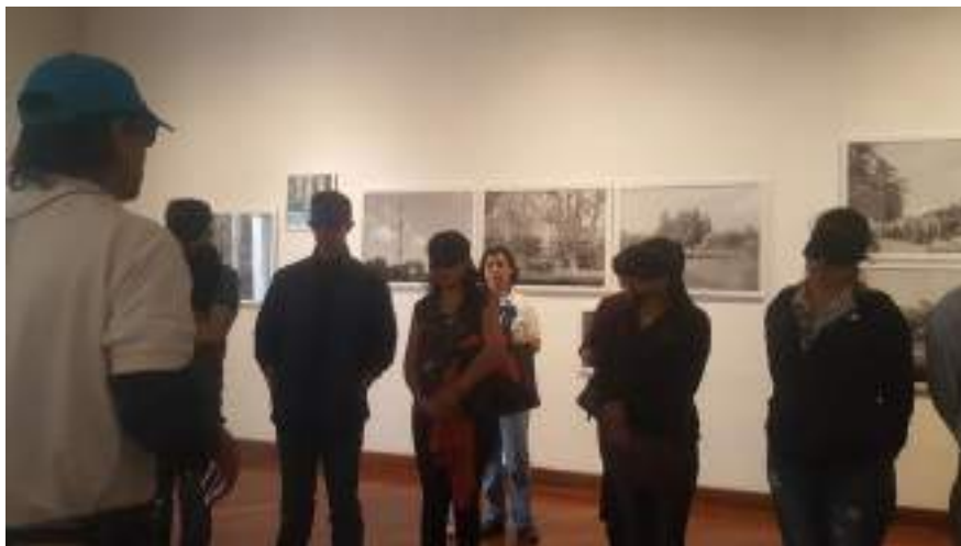
Figura 3.12. Técnicas de Guianza aplicadas a la generación de experiencias.

elementos, solo desde la experiencia y realidad de los ciegos se pueden generar estrategias de atención.