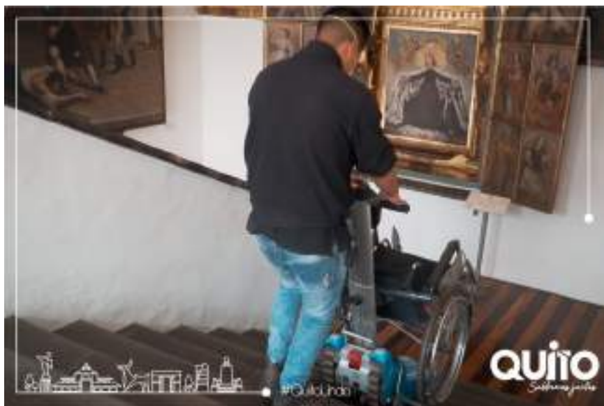
Figura 2.5. Recorrido por la Capital.