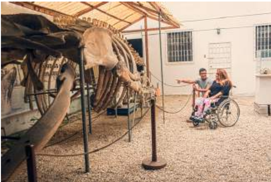
Figura 2.6. Turista accediendo a puntos atractivos de Guayaquil.