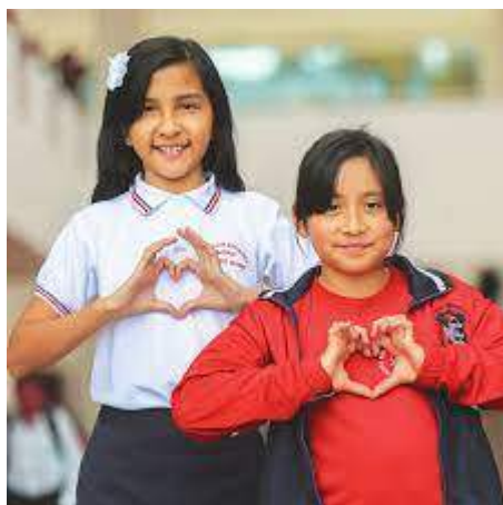
Figura 3.13. El Lenguaje de Señas.

Desde un enfoque social, se considera que el éxito de los proyectos desarrollados con personas con discapacidad visual, gira en torno a la concientización de las personas que se encuentran en la primera línea de atención, es necesario que el sector turístico se capacite en cursos de sensibilización que les permitan conocer las necesidades de este segmento de mercado, entender su manera de relacionarse y de aceptar su discapacidad, conocer sus reacciones, su manera de ser y empatizar con todo lo gira en torno a este grupo social.