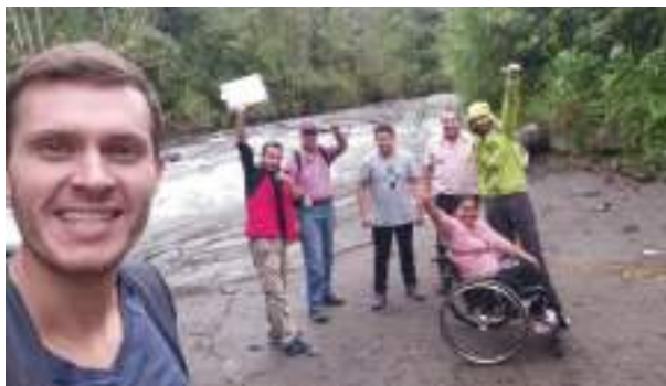
Figura 2.4. Recorrido con visitantes son discapacidades por los recursos naturales de Yunguilla