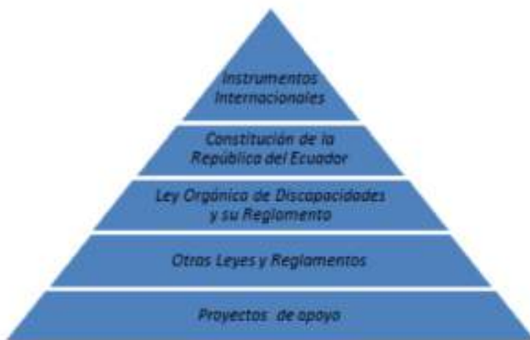
Figura. 1.5. Normas técnicas

Las normas técnicas son una herramienta realizadas con estándares de calidad tendientes a garantizar que las acciones que van dirigidas a fortalecer la protección e inclusión social y económica de las personas con discapacidad sean dirigidas de forma efectiva, para que la inclusión se vaya de la mano con las personas que asumen el cuidado y acompañamiento .Este documento es válido para todas las personas que se desenvuelven como prestadores de servicios en este campo, están comprometidos asumir la modalidad que consideren y que se estable en la presente norma “El Ministerio de Inclusión Económica y Social –MIES-, de conformidad con el Art. 87 de la Ley Orgánica de Discapacidades, conjuntamente con los Gobiernos Autónomos Descentralizados, se encarga de la inclusión social de las personas con discapacidad y sus familias, para lo cual articula la formulación, ejecución, seguimiento y evaluación de las políticas con entidades públicas y privadas, a nivel central y desconcentrado, con la participación y corresponsabilidad de la familia y la comunidad”. (MINISTERIO DE INCLUSIÓN ECONÓMICA Y SOCIAL, 2012)