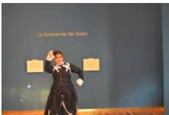
Figura 3.21. Puesta en escena proyecto Quito Silencio.