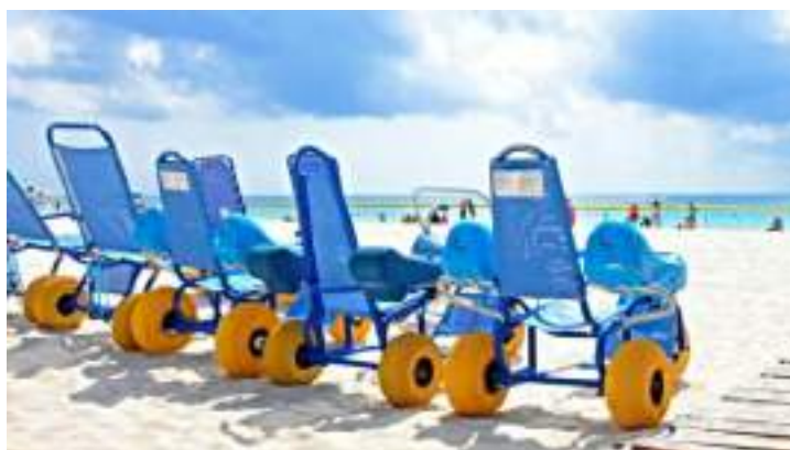
Figura 02. Sillas accesibles en las playas de Salamanca