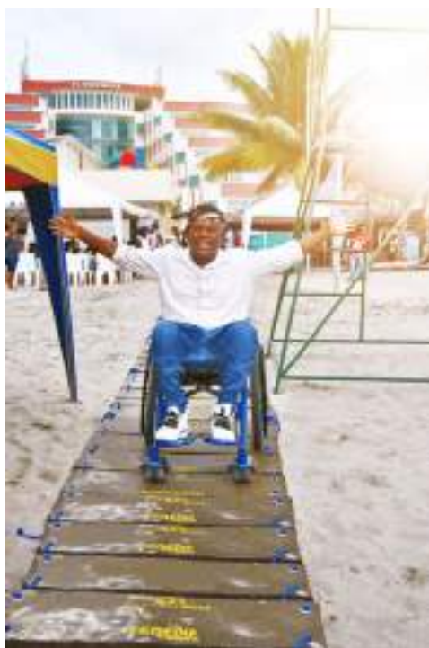
Figura. 2.8. Alfombra de playa de material reciclado en Atacames

La construcción de esta iniciativa facilitará la movilidad y disfrute del usuario con algún tipo de discapacidad. Además, este lugar, ofrece a los turistas locales, nacionales e internacionales, con o sin discapacidad, una playa segura y bien equipada en la que podrán disfrutar en igualdad de condiciones.