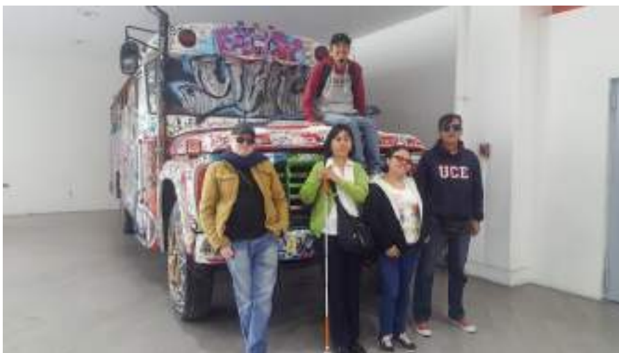
Figura 3.9. Grupo Viviendo Quito con Sentidos.