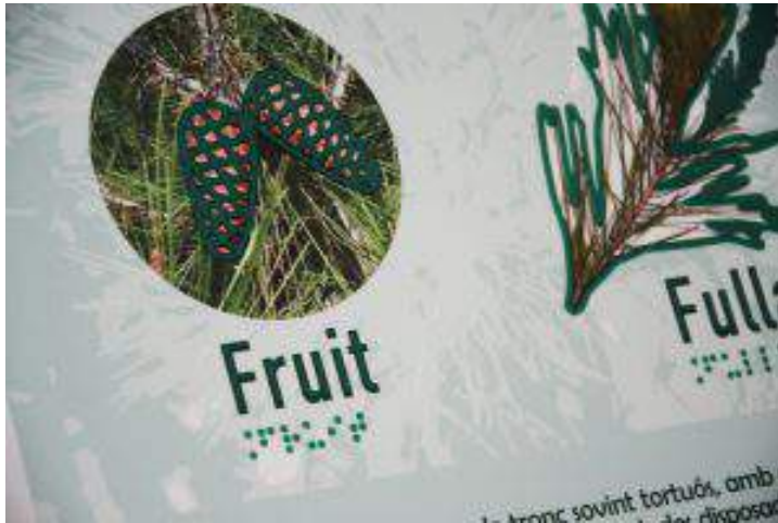
Figura 03. Planos interpretativos en alto relieve. Fuente: PUNTODIS.com. 2020.