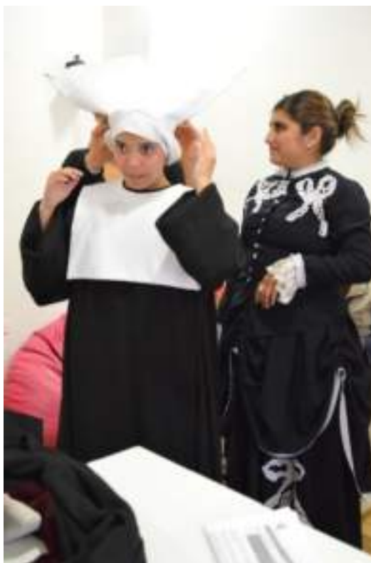
Figura 3.17. Prueba de Trajes personajes

La gente siente temor al momento de realizar una guianza y eso puede generar una experiencia enriquecedora.