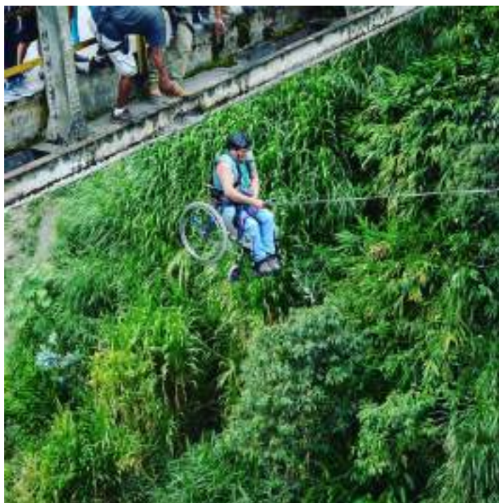
Figura 3.31. Experiencias en la operación de Turismo Accesible

Es importante además entender que no necesariamente un hotel con la certificación de accesibilidad lo es ya que depende de lo que se genera entorno a esa certificación, la cadena de valor completa debe trabajar bajo estrategias de accesibilidad.