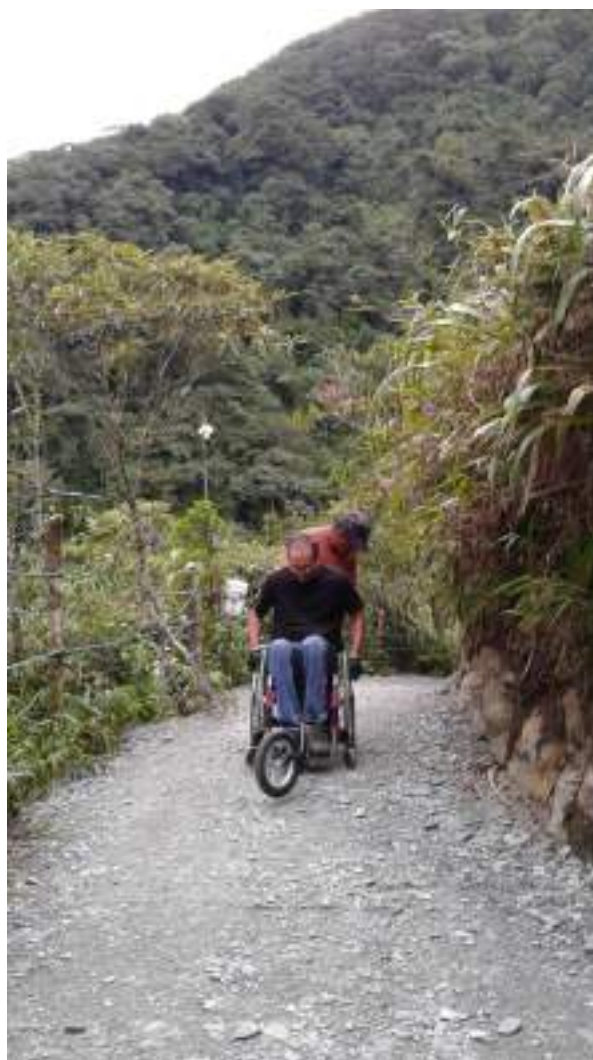
Figura 3.29. Senderos para operación Turismo Accesible, REDTAE