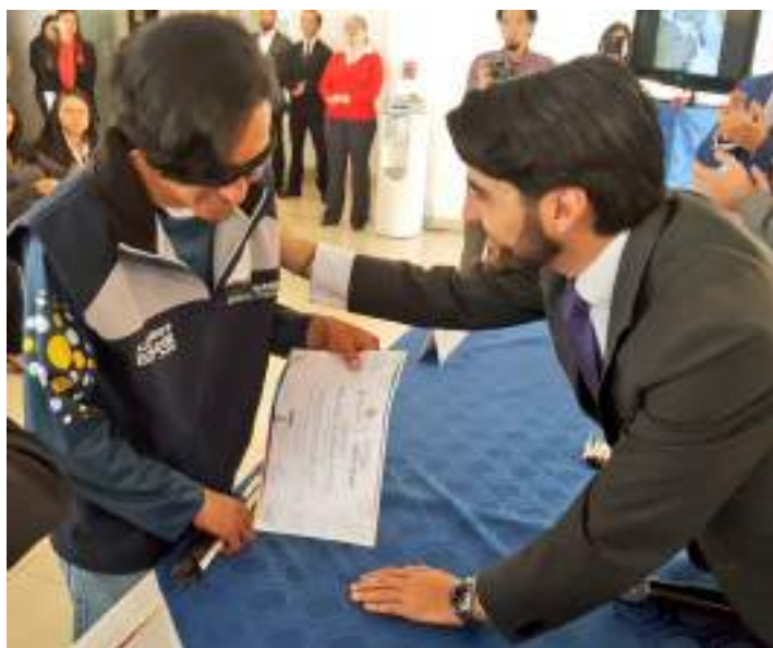
Figura 3.6. Certificación a Guías de Turismo Locales Centro Histórico de Quito, dirigido a Personas con Discapacidad Visual.