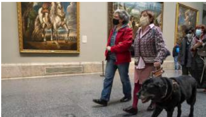
Figura 3.1. Proyectos Fundación ONCE