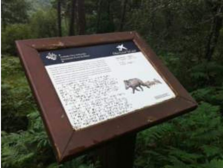
Figura 05. Material interpretativo en Braille.