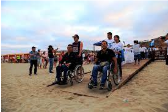
Figura. 2.7. Turista accedendo a puntos atractivos de Guayaquil.

La provincia de Manabí está ubicada en la parte interior de las costas ecuatorianas, especialmente en los montes, así como también en las riberas de los ríos y carreteras.