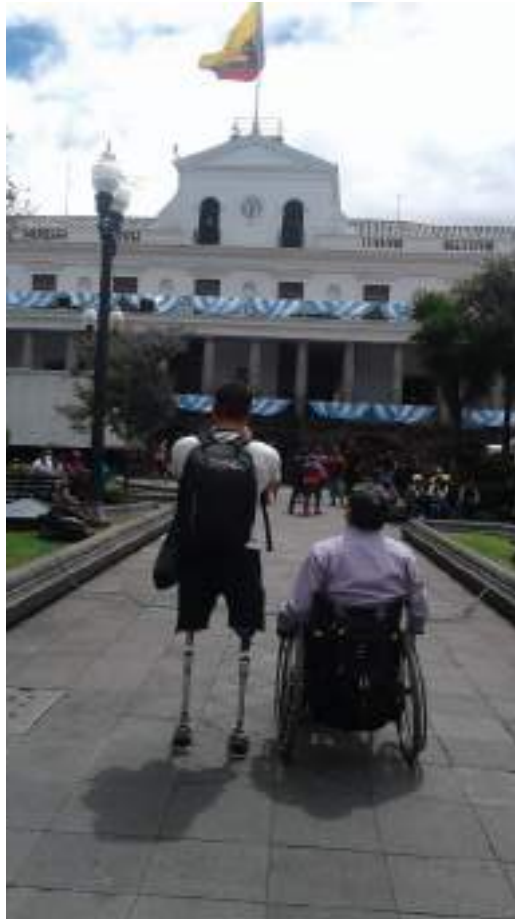
Figura 3.26. Experiencias en operación Turística REDTAEC