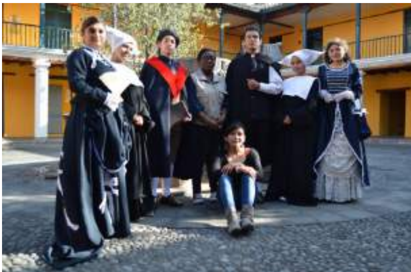
Figura 3.23. Grupo Recorrido Teatralizado en Lengua de Señas Museo de la Ciudad con la participación de estudiantes sordos del INAL

“El reto está en hacer una ciudad, no solo más accesible, sino sensible”