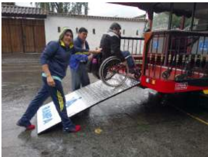
Figura 3.32. Accesibilidad en la Operación Turística, REDTAE

personal entrenado para que puedan calificar los espacios y destinos con accesibles, ya que el personal desconoce del contexto en general y de las necesidades específicas de cada segmento de mercado con características de discapacidad, esto se traduce a que cuando los técnicos realizan las visitas de inspección no cuenta con la asesoría necesaria que le permitan evaluar aspectos como identificar si los establecimientos cuentan con baños grandes, accesos ascensores, ancho de las veredas, señalética especializada entre otros, calificándose así a establecimiento que no cumplen con las normas técnicas mínimas”