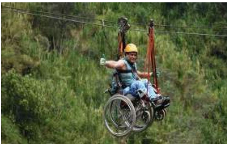
Figura 2.2. Adaptación del Canopy para turistas con sillas de ruedas

La diversa oferta de actividades y atractivos turísticos hace de Baños un destino bastante accesible a todo nivel. Además de contar con una planta hotelera, restaurantera y de operadoras de turismo para todo los presupuestos y gustos y preferencias de los clientes. Esta ciudad se ha posicionado en mercado nacional e internacional en modalidades de turismo como el de aventura, de naturaleza, de termas, religioso y todo esto complementado con una amplia oferta de bares y discotecas, y algunas actividades complementarias hacen que la demanda sea constante especialmente por consumir los tours por los principales atractivos naturales.