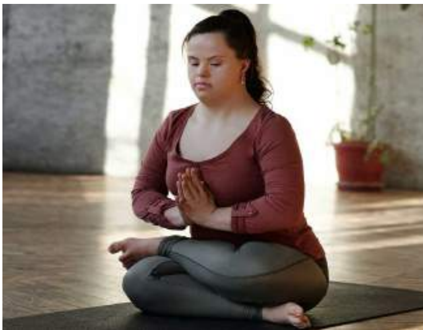
Figura 1.3. Inclusión en deportes y otras actividades físicas.

persista la discriminación en su entorno social, deben ser incluido mediante a la creación de ambientes sociales acordes a sus necesidades, se requiere una serie de compromisos de parte de los gobiernos, políticas públicas que amparen su desenvolvimiento y participación como sujetos productivos en la Sociedad y sus espacios. Sobre todo, que dentro de la medicina sea considerado como un déficit.