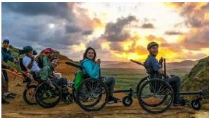
Figura 01. Turismo accesible

Fuente: UNE-ISO 21902. establece los requisitos y recomendaciones para un turismo accesible.