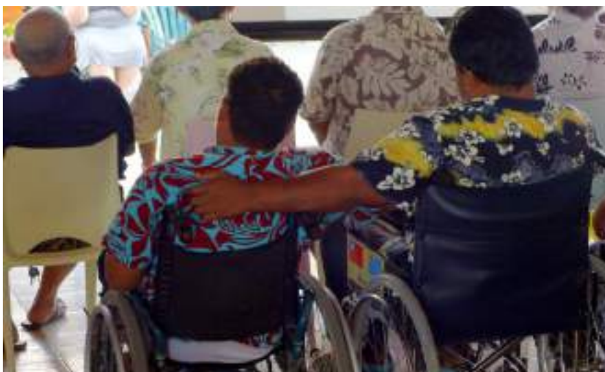
Figura 1.4. Inclusión en capacitaciones y otras actividades de formación educativa