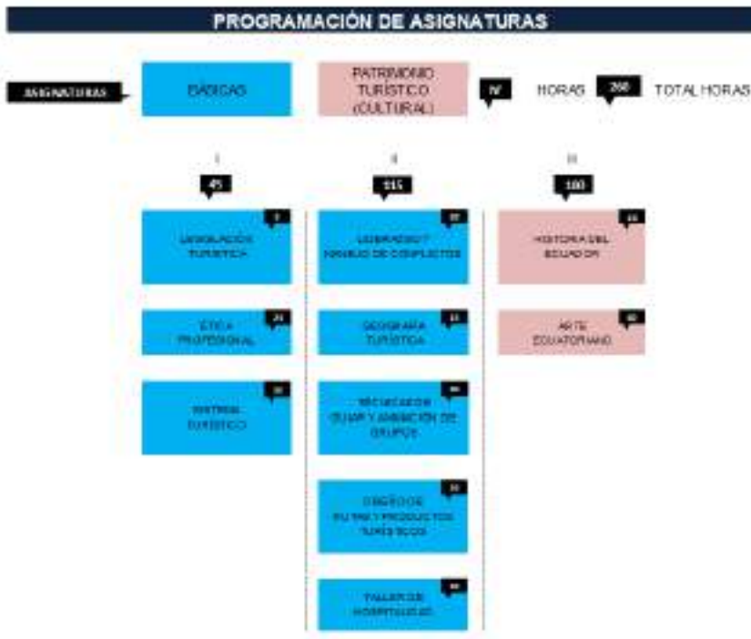
Figura 3.3. Malla contenidos curso de capacitación Proyecto Guías Locales de Turismo en el Centro Histórico, dirigido a Personas con Discapacidad Visual.

La Universidad de las Fuerzas Armadas ESPE a través de su empresa pública estuvo a cargo de las capacitaciones que se las realizaron por un período de aproximadamente 3 meses.