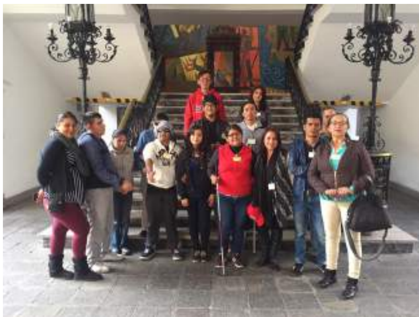
Figura 3.5. Recorridos Guiados Centro Histórico de Quito.

La capacitación involucraba recorridos de reconocimiento práctico por los diferentes atractivos en los cuáles se contó con el apoyo de iglesias, museos, empresas públicas y privadas que abrieron sus puertas para que los estudiantes puedan adquirir la experticia necesaria para la aplicación de técnicas que permitan dar a conocer a turistas que visitan el centro histórico y desean vivir una experiencia diferente.