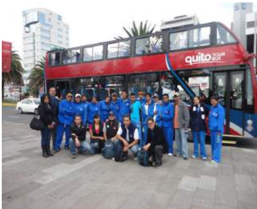
Figura 3.16. Recorridos proyecto Vinculación Guianza en Lengua de Señas UDET-INAL