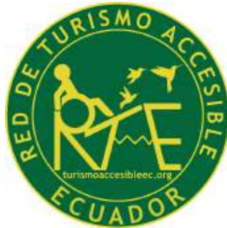
Figura 3.24. Logotipo REDTAEC