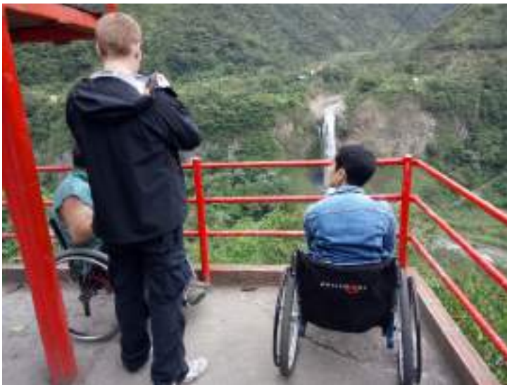
Figura 3.33. Operación Turística Accesible en el Ecuador

A criterio de REDTAEC, el Ecuador tiene los siguientes retos en cuanto al desarrollo turístico accesible.