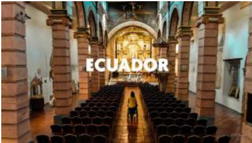
Figura 2.3. Caminerías adecuadas para personas con ausencia de movilidad en templos de Cuenca