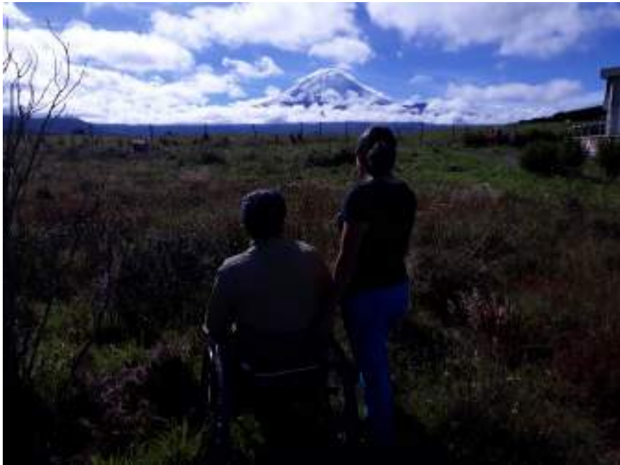
Figura 3.36. Turismo Accesible Ecuador