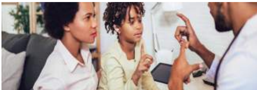
Figura 1.1. Acompañamiento a las personas con discapacidad.

en la sociedad en igualdad de condiciones con los demás. Según el (Informe Mundial sobre la Discapacidad, 2011) alrededor del 15% de la población vive con algún tipo de discapacidad. Las mujeres tienen más probabilidades de sufrir discapacidad que los hombres y las personas mayores más que los jóvenes. OPS (Organización Panamericana de la Salud, 2011)