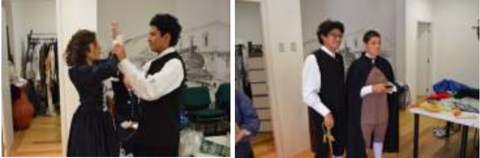
Figura 3.18. Prueba de Trajes personajes