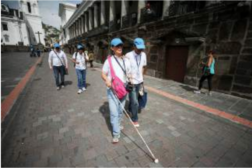
Figura 3.7. Recorridos Centro Histórico de Quito, guiados por personas con discapacidad visual.