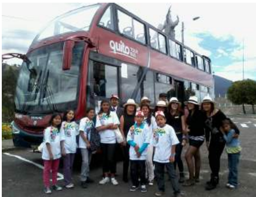
Figura 3.15. Recorridos Quito Tour Bus, estudiantes Instituto de Audición y Lenguaje

La ejecución de dicho proyecto necesitaba de inversión económica, por lo que se procedió a aplicar la estrategia de auspicios, bajo un tema de responsabilidad social el proyecto contó con auspicios de organismos públicos como privados, entre ellos QuitoTour Bus, quienes colocaron parte del dinero para entradas a museos y demás sitios de visita.