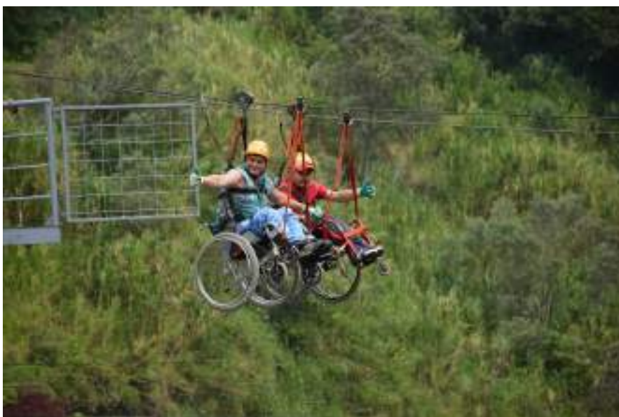
Figura 3.35. Canopy Turismo Accesible Ecuador