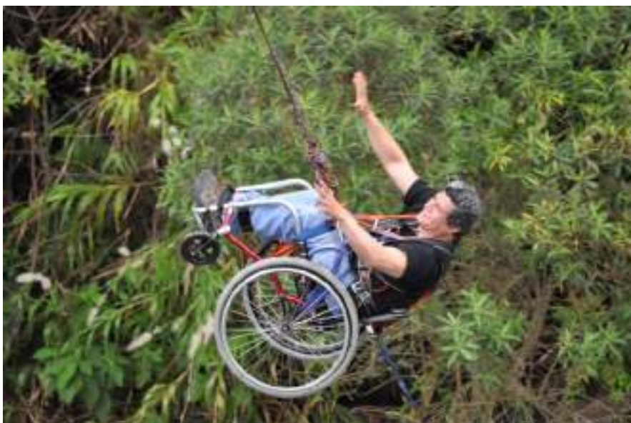
Figura 3.28. Experiencias en Turismo Accesible, REDTAEAC