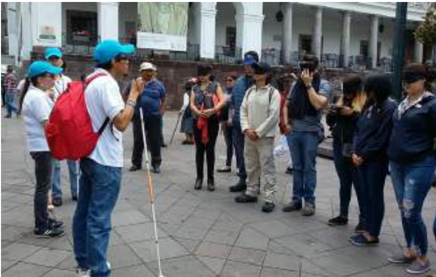
Figura 3.2. Guianza Centro Histórico Proyecto Viviendo Quito con Sentidos.