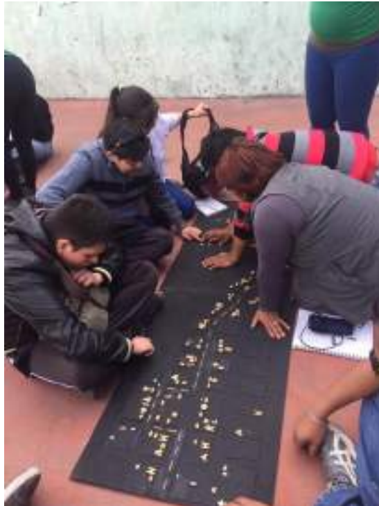
Figura 3.4. Material Pedagógico utilizado en curso de capacitación a Guías Locales de Turismo en el Centro Histórico, dirigido a personas con Discapacidad Visual.

Se armaron maquetas de las diferentes rutas que forman parte de la oferta turística en el centro histórico y se consideran aptas para ser potenciadas, se colocaron en ellas formas de los principales atractivos y se resaltó con diferentes materiales las infografías de servicios complementarios, para que de esta forma los estudiantes se familiaricen desde las aulas y pueden desenvolverse de mejor manera en los recorridos prácticos. Para la elaboración del material se contó con el apoyo de los estudiantes de la Carrera de Turismo de la ESPE, quienes bajo un enfoque de responsabilidad social aportaron al proyecto de una manera muy responsable y solidaria.