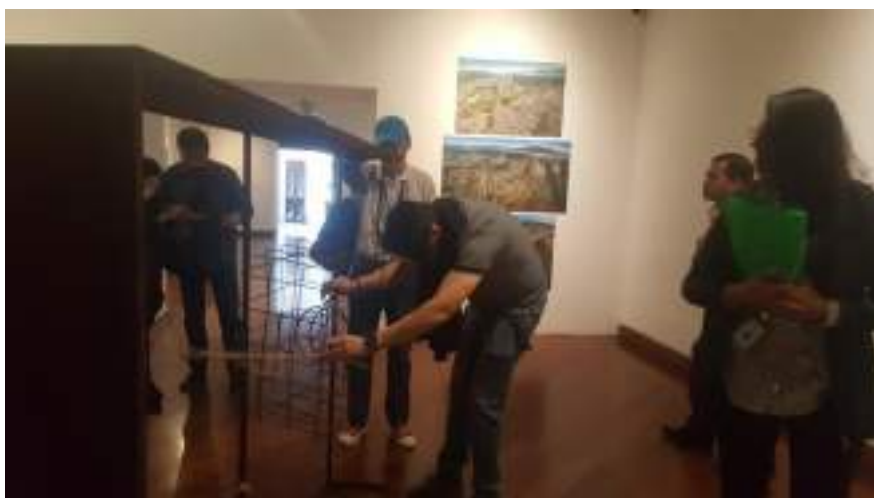
Figura 3.10. Técnicas de Animación Turística y Neuromarketing.