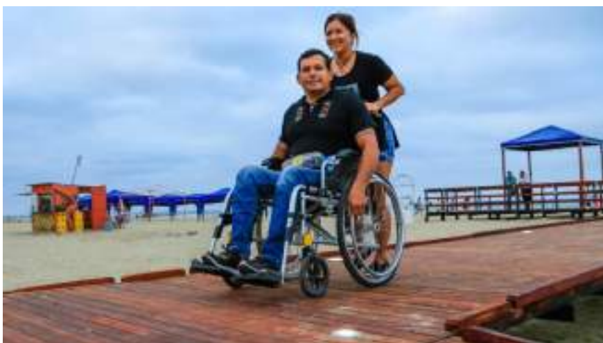
Figura 2.1. Rampa de acceso a personas en silla de ruedas, Playa Murcielago – Manta