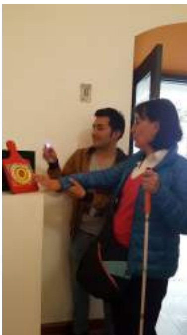
Figura 3.11. Animación Turística en museos grupo Viendo Quito con Sentidos .

Los retos en el campo de turismo accesible en general y especializado para personas con discapacidad visual se pueden analizar desde dos escenarios: