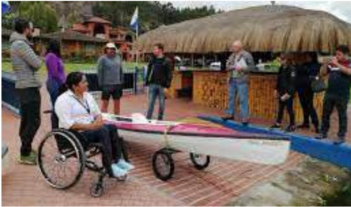
Figura. 2.9. Turista accedendo a puntos atractivos de Guayaquil.